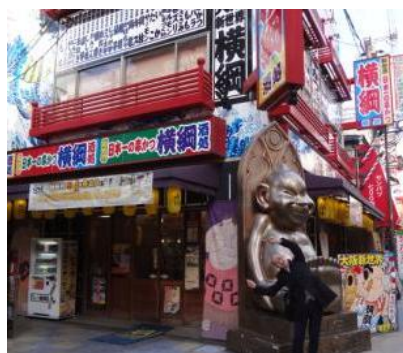
懇親会会場&ビリケン